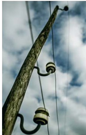
'Elektriek, dat kenden we toen helemaal niet. Boeren hadden thuis alleen een petroleumlamp.'