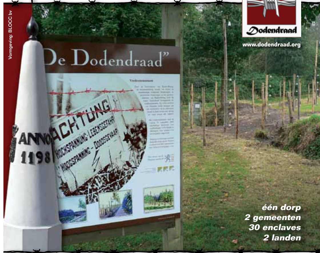
Vormgeving: BLOCC bv

één dorp 2 gemeenten 30 enclaves 2 landen